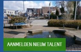
AANMELDEN NIEUW TALENT

Bent u op zoek naar een specifiek talent voor korte tijd, eenmalig of flexibel? Mensen willen juist hun kennis, vaardigheden en ervaring delen waarin zij erg goed zijn. Naast een vacature plaatsen, kunt u ook zelf op zoek gaan naar vrijwilligers voor uw organisatie in de Talentenbank! Bijvoorbeeld naar iemand die graag af en toe kookt, iemand die het leuk vindt om op een evenement te schminken, iemand die kennis heeft over het aanvragen van subsidies/fondsen of een coach voor vrijwilligers.