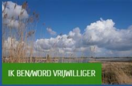
IK BEN/WORD VRIJWILLIGER