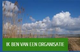
IK BEN VAN EEN ORGANISATIE